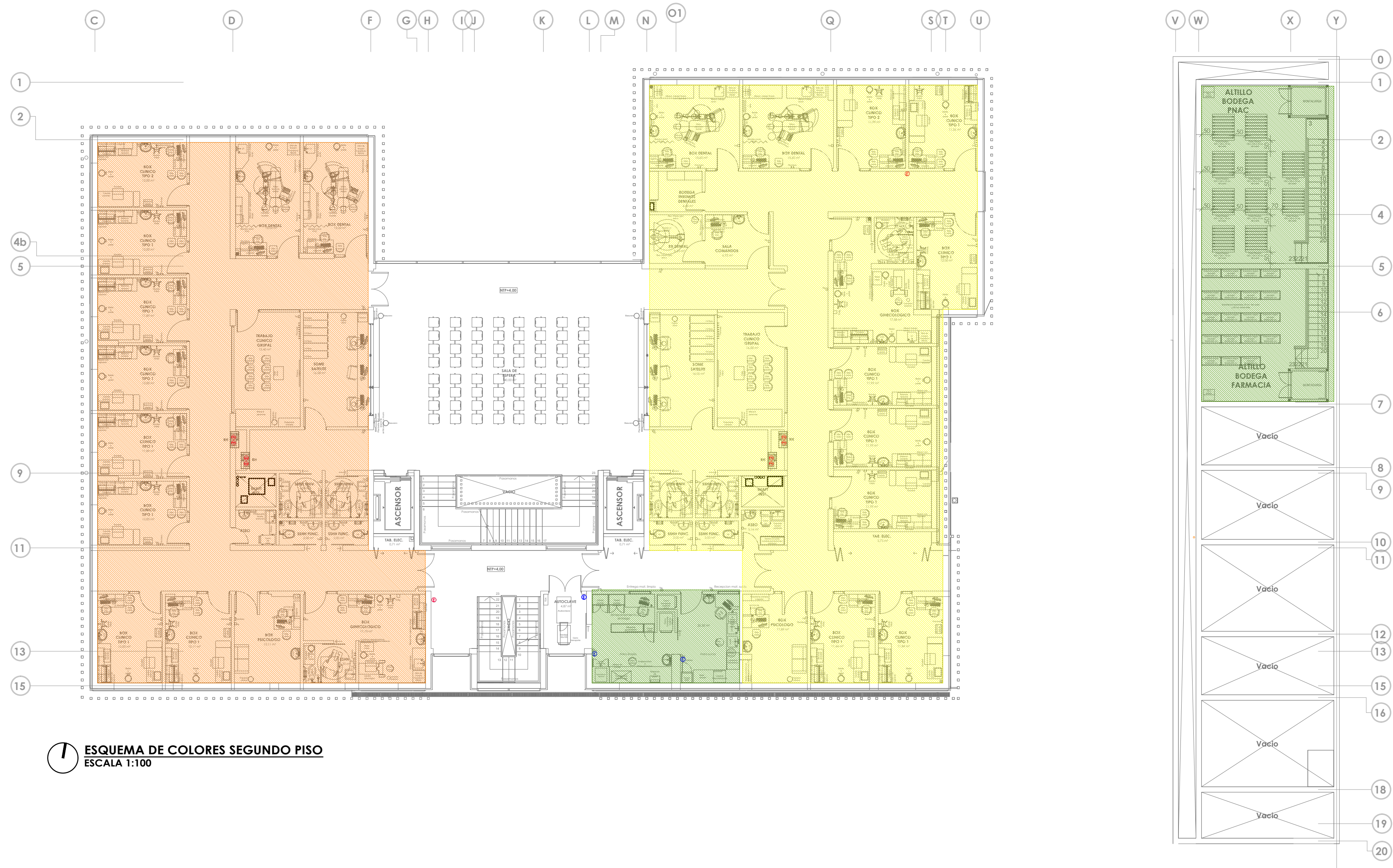
ESQUEMA DE COLORES SEGUNDO PISO ESCALA 1:100